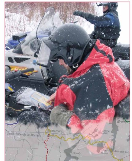
PHOTOGRAPHIE PAGE COUVERTURE

14 Le suivi en temps réel des véhicules de déneigement à la Ville de Sherbrooke