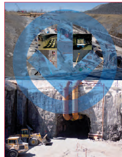
PHOTOGRAPHIE PAGE COUVERTURE

Photo montage du chantier du métro sur l'île de Laval.