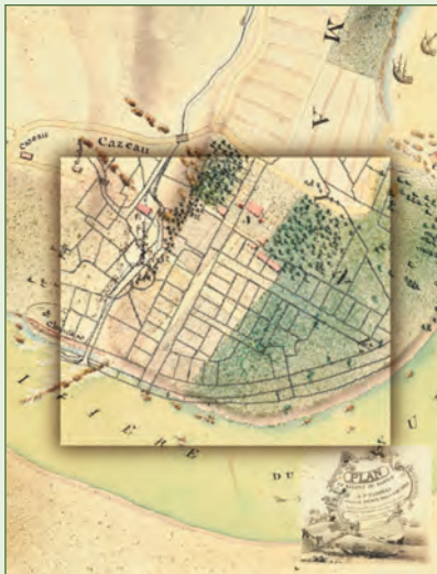
Photographie page couverture

Extrait d'un plan de 1819 de l'arpenteur Jean B. Duberger à l'embouchure de la rivière du Sud à Montmagny. Reproduit avec la permission expresse du Bureau de l'arpenteur général du Québec.