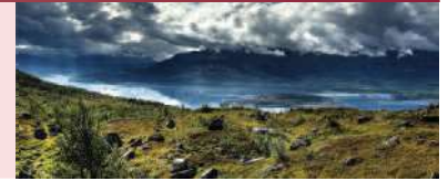
Le parc national Stora Sjöfallet, en Suède

La revue Géomatique est publiée sous l'égide de l'Ordre des arpenteurs-géomètres du Québec, à l'intention des intervenants dans les domaines de l'immobilier, des affaires municipales et de la géomatique.